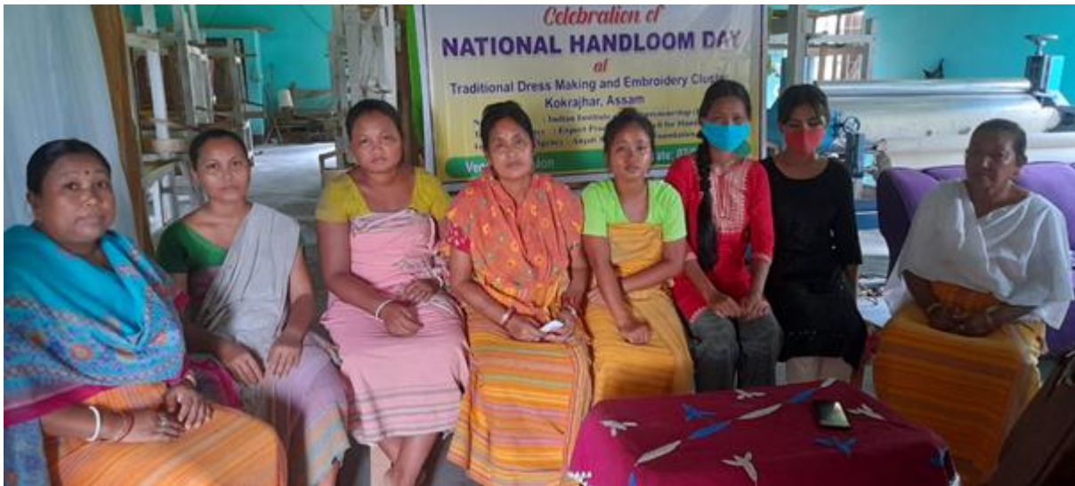
National Handloom Day celebrated at Traditional Dress Making Cluster Kokrajhar, Assam organized by EPCH