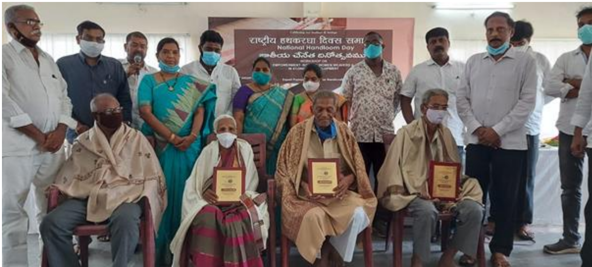
FELICITATION OF SENIOR HANDLOOM WEAVERS DURING National Handloom Day celebrated at International Lace Trade Centre, Narsapur, Andhra Pradesh organized by EPCH alongwith SHRI K. N. TULASI RAO, MEMBER, COMMITTEE OF ADMINISTRATION-EPCH